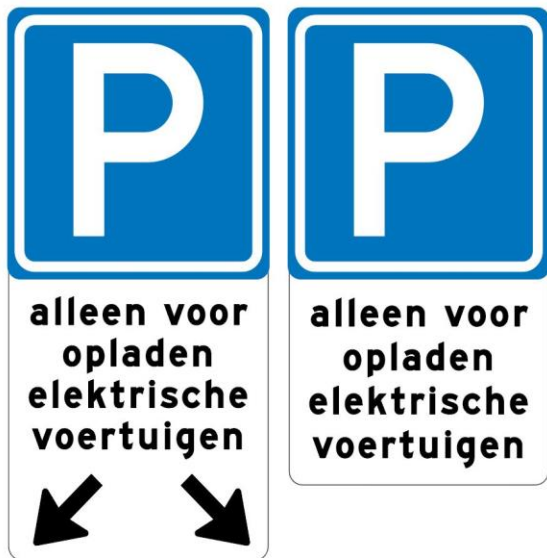
Bebording bij openbare laadvakken